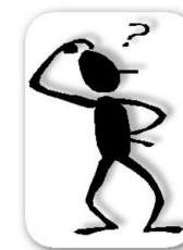
Tavola di concordanza